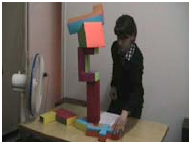
On fera quelque chose d'intéressant la prochaine fois performance, décembre 2008, Le Commissariat, Paris