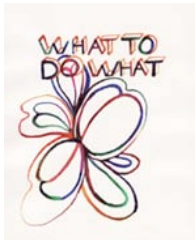
Sans titre , 2007 encres de couleur sur papier, 21x29,7 cm

Dans ses séries de dessins ou de vidéos comme dans ses performances, Roxane Borujerdi s'arrange pour mettre avec humour en question l'une ou l'autre des certitudes qui décident de la perception commune de l'environnement où elle se trouve. Décalage, détournement, substitution de contextes, brouillage fin de l'ordre des signifiants ou copier-coller des imageries, elle soumet à ses opérations provocatrices les matériaux qui lui viennent des petits riens de la vie quotidienne ou des coupures de presse, des bandes dessinées ou des paroles du jour.