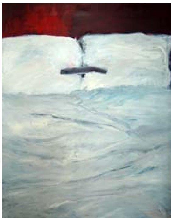
Wounded, 2007 huile sur toile, 100x110 cm

Cigdem Menteshoglu contemple le quotidien, aime se perdre dans la diversité des souvenirs, des expériences, des relations entre les gens.