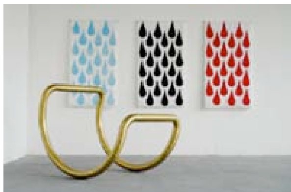
Rocking-transat , 2008 laiton et 3 toiles coton sérigraphiées (65x120 cm)