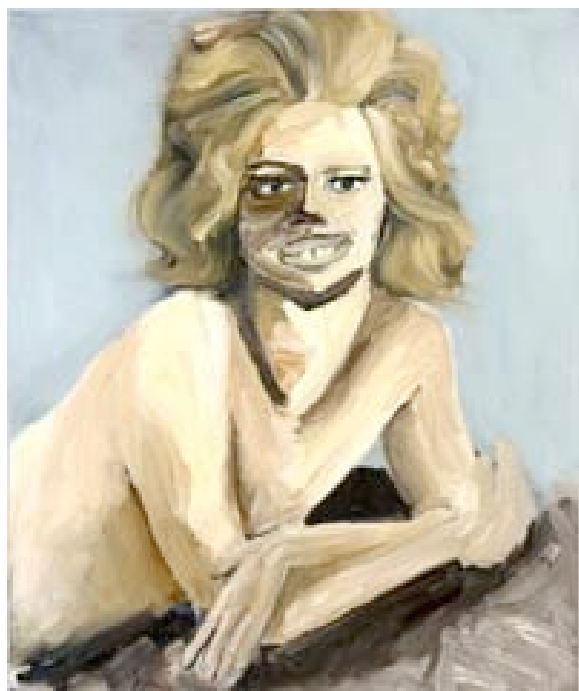
The Signifying Donkey's Feat , 2003 huile sur toile, 77x92 cm