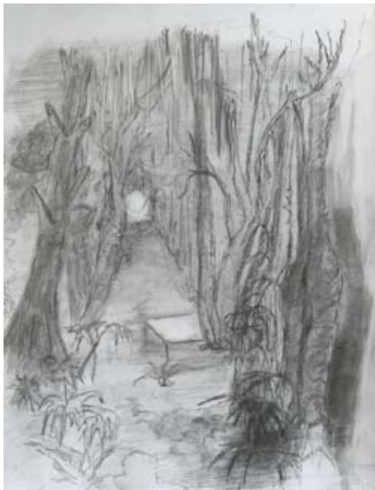
In to the woods, 2008 crayon sur papier, 25x35 cm