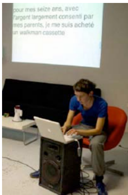
Performance pédagogique 15 octobre 2005, Le Plateau, Paris