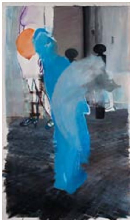
Meeting, 2008 huile sur toile, 150x170 cm