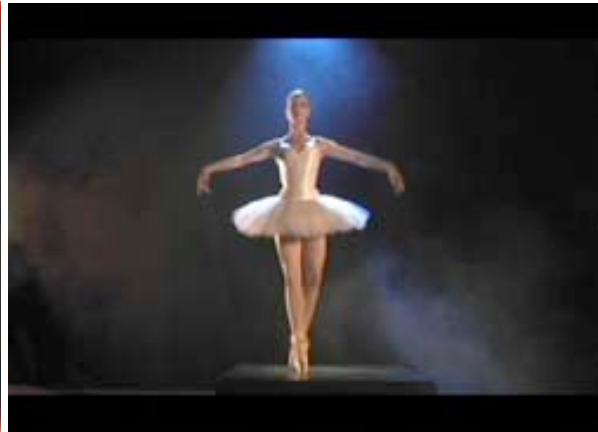
La boîte à musique Installation vidéo 6'00''