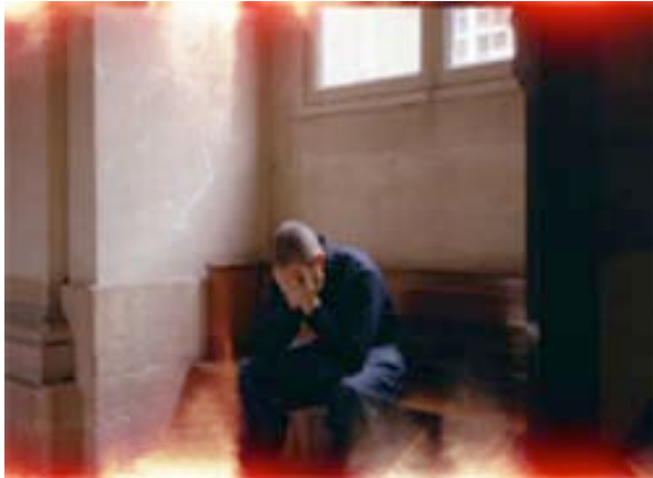
Attente du verdict, 2004 Photographie argentique