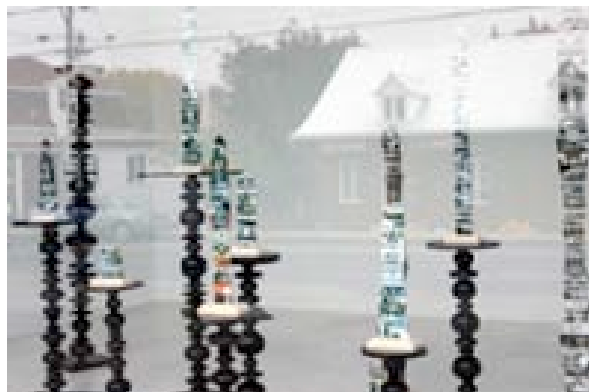
Haltères , 2008 bois tourné laqué, dimensions variables

Je crée des choses inspirées par ma quête du bonheur.