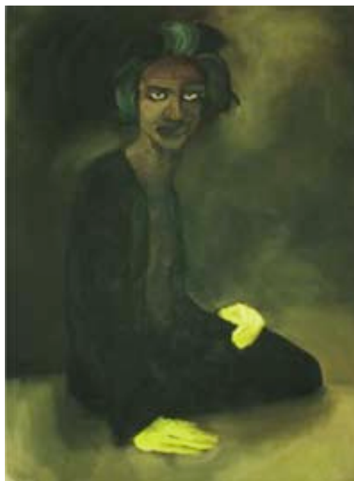
Magret de Canard , 2005 huile sur lin, 213x162,5 cm

Mon travail se réfère à la tradition européenne du portrait. La nature du médium et la façon dont il doit être travaillé alimente mon travail et génère mes idées. Il est important que le sujet provienne de l'acte même de peindre, que tout ne soit pas anticipé ou planifié. J'essaie d'éviter l'habitude de choisir un sujet ou idée et puis tenter de l'illustrer. Je préfère commencer avec une préoccupation plus pertinente telle la lumière ou la couleur et tenter d'y arriver. Le maniement de la peinture est l'idée même et doit porter le sujet au spectateur. Je trouve que c'est une approche de travail beaucoup plus surprenante, sensuelle et logique.