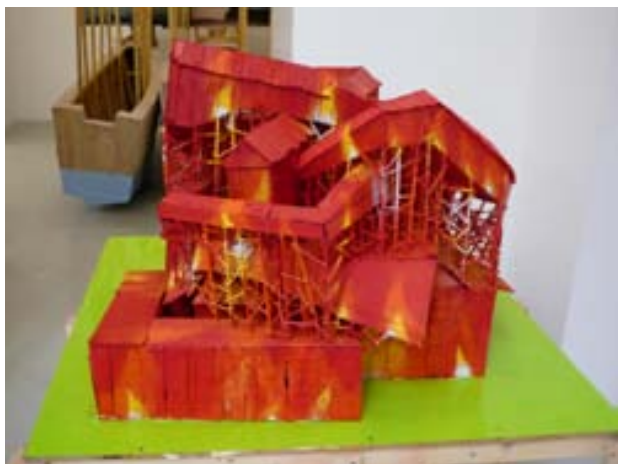
Erehwon P.O.V. , 2009 bois, peinture glycérophtalique, aluminium, lecteur DVD, plâtre, peinture acrylique, goudron, tirage contrecollé sur aluminium; dimensions variables