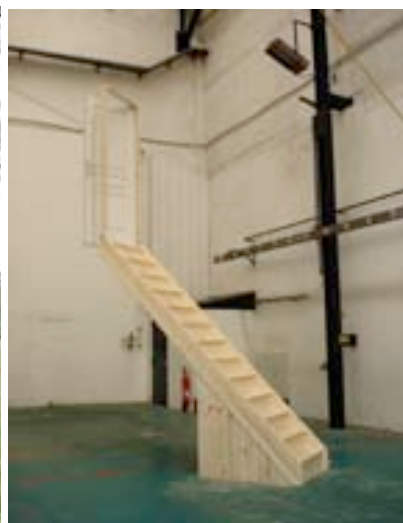
Un parajo se bana en la puerta abierta , 2008 bois, 480x80x280 cm

N'ayant pas de pratique de prédilection Noah Wiegand utilise aussi facilement la peinture, la vidéo, la performance que l'installation. Autant de formes qui servent à un projet plus vaste, un projet pour le moins animé d'un grand sens de l'ironie voir même une dérision contagieuse.