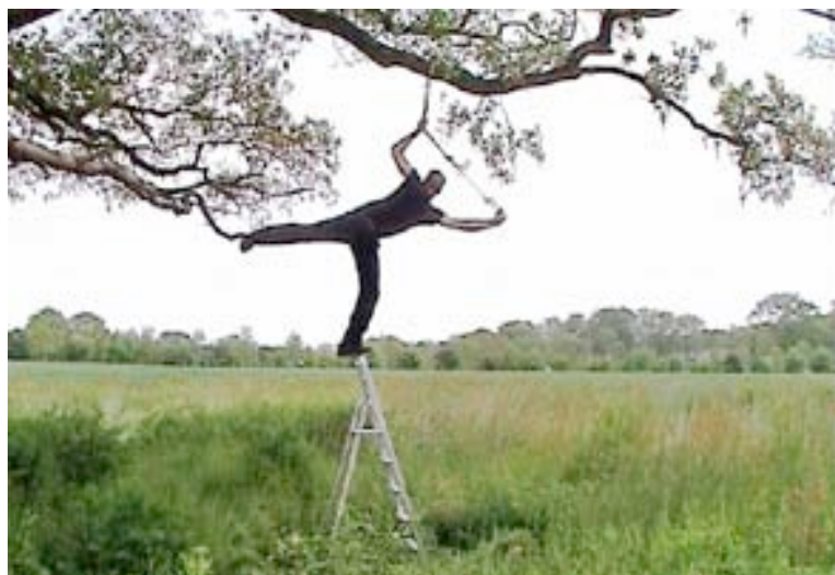
L'insolite légèreté de l'être , 2006 vidéo 04'57''