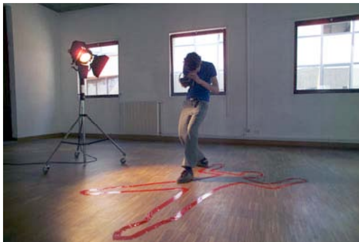
DNSEP 2005, 31 mai 2005 École Nationale Supérieure d'Art de Paris-Cergy

Le travail performatif que j'ai pu à peu construit depuis 5 ans consiste en une mise en scène de moi-même (parfois, d'autres interprètes viennent s'ajouter) dans des performances que je conçois comme des investissements corporels éphémères. Ils sont coulés dans un réseau multiple et compliqué de micro territoires enchâssés, connexes ou juste contiguës (je parle ici d'une territorialisation physique, qui peut être purement géographique, mais qui se manifeste aussi « abstraitement », dans le champ sémantique, par exemple, ou par des glissements de tous ordres, d'une idée à une autre, et qui peut brutalement mettre en connivence deux éléments à première vue étrangers).