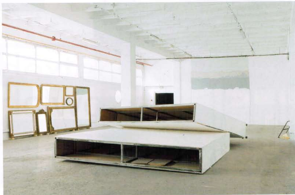
Matthieu Clainchard Peinture de grande hauteur, 2010; titre, 2010; Broken glass everywhere pissing on the stairs, you know they care / I can't take the smell, I can't noise no more, 2010; Double symé 2010